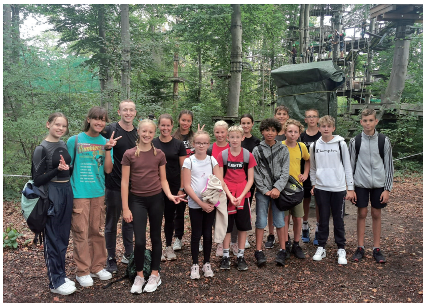
Die Schwimmer im Kletterwald